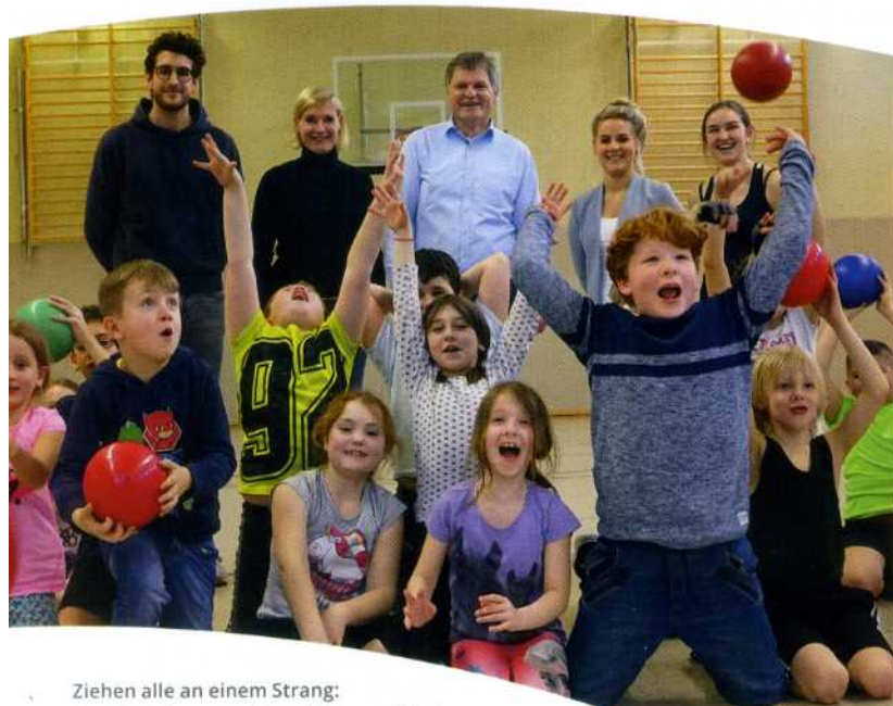
Ziehen alle an einem Strang: der KSB Viersen, die Paul-Weyers-Schule, die Stadt Viersen und die LG 1947 Viersen